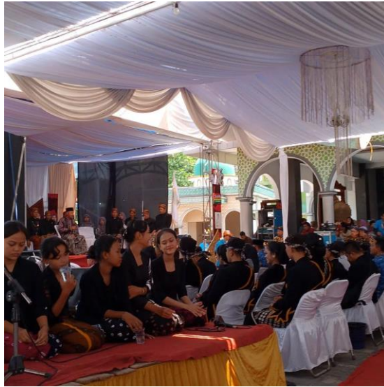
Gambar 3. Upacara Meron

Upacara Meron di Kecamatan Sukolilo dilakukan dalam beberapa tahap (Zuhdi, 2024). Tahap pertama adalah persiapan, yang meliputi pembentukan panitia, penentuan tanggal pelaksanaan, pembuatan undangan, dan berbagai persiapan lainnya. Tahap kedua adalah pelaksanaan upacara itu sendiri. Sebelum upacara inti, ada beberapa kegiatan pendahuluan. Kemudian, puncak acaranya adalah arak-arakan gunung Meron. Setelah arak-arakan, acara diakhiri dengan doa bersama. Tahap terakhir adalah pasca upacara, di mana gunung Meron dibawa kembali ke tempat penyimpanan.