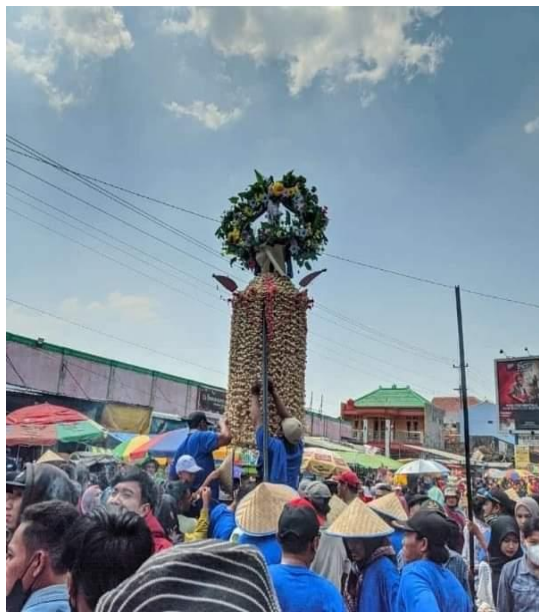
Gambar 1. Tradisi Meron

Permohonan tersebut disetujui, dan sejak saat itu masyarakat Sukolilo pun mulai mengadakan upacara tahunan yang mirip dengan sekaten . Namun, seiring berjalannya waktu, nama upacara tersebut berubah menjadi Meron . Tradisi Meron ini kemudian terus dilestarikan oleh masyarakat Sukolilo hingga saat ini, sebagai bentuk penghormatan kepada para leluhur dan juga sebagai simbol persatuan dan kesetiaan.