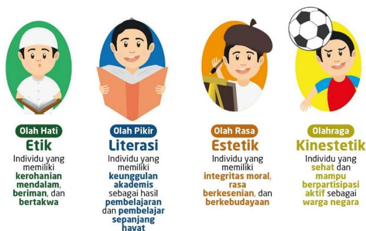
Gambar 2. Filosofi pendidikan Ki Hadjar Dewantara

Ki Hajar Dewantara menyebutkan bahwa menumbuhkan nilai-nilai moral ke dalam jiwa seorang anak sangatlah penting. Ki Hajar Dewantara dalam bukunya Wiryopranoto mengatakan tentang pendidikan budi pekerti harus diarahkan pada pembentukan karakter bangsa yang sesuai dengan nilai-nilai agama dan budaya bangsa (Wiryopranoto et al., 2017). Hal ini berarti menumbuhkan nilai-nilai moral dan pendidikan karakter sangat perlu untuk diterapkan secara konsisten terhadap siswa sehingga akan menghasilkan suatu kebiasaan dan menjadi budaya. Hal ini juga sejalan dengan Tim Pendidikan Karakter Kemendiknas yang mengatakan bahwa pengembangan karakter dilakukan melalui beberapa tahapan, yaitu pengetahuan (knowing), pelaksanaan (acting), dan kebiasaan (habbit) (Kementrian Pendidikan Nasional, 2011). Ki Hadjar Dewantara mengatakan bahwa Pendidikan ialah usaha kebudayaan yang bermaksud memberi bimbingan dalam hati, raga, pikir, dan karsa anak agar dalam kodrat pribadinya serta pengaruh lingkungannya, mereka memperoleh kemajuan lahir batin menuju kearah adab. Sedang yang dimaksud dengan adab kemanusiaan adalah tingkatan tertinggi yang dapat dicapai oleh manusia yang berkembang selama hidupnya. Artinya dalam mencapai kepribadian seseorang atau karakter seseorang, maka adab kemanusiaan adalah tingkat yang tertinggi (Hasibuan et al., 2018).