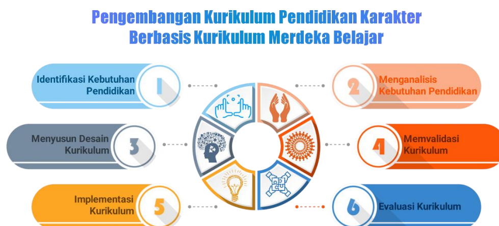
Gambar 7. Langkah-langkah pengembangan kurikulum pendidikan karakter di Madrasah

Prosedur pengembangan kurikulum pendidikan karakter di Madrasah menggunakan kurikulum Merdeka adalah beranjak dari identifikasi problem karakter yang dihadapi Madrasah sehingga dirasa perlu mengintegrasikan nilai-nilai karakter kedalam seluruh komponen pendidikan. Adapun langkah-langkah pengembangan kurikulum terdiri dari beberapa tahapan simultan, yakni 1) mengidentifikasi kebutuhan pendidikan, 2) menganalisis kebutuhan pendidikan, 3) menyusun desain kurikulum, 4) memvalidasi kurikulum, 5) mengimplementasi kurikulum, 6) mengevaluasi kurikulum (Cahyono, 2022).