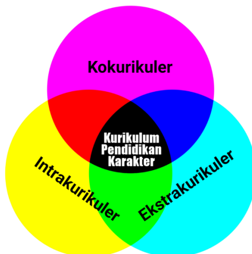
Gambar 4. Integrasi pendidikan karakter

Kegiatan intrakurikuler adalah kegiatan pembelajaran untuk pemenuhan beban belajar dalam kurikulum sesuai dengan ketentuan peraturan perundang-undangan. Penyelenggaraan kurikulum pendidikan karakter dalam kegiatan intrakurikuler merupakan penguatan nilai-nilai karakter melalui kegiatan penguatan materi pembelajaran, metode pembelajaran sesuai dengan muatan kurikulum (Peraturan Presiden, 2017). Pelaksanaan kurikulum pendidikan karakter pada kegiatan intrakurikuler dilakukan dengan pengintegrasian nilai-nilai karakter pada mata pelajaran. Pengintegrasian pendidikan karakter dalam pembelajaran merespon sejumlah kelemahan dalam pelaksanaan pendidikan akhlak dan budi pekerti (pendidikan karakter). Berikut ini adalah upaya inovasi pendidikan karakter di Madrasah adalah, 1) Pendidikan karakter dilakukan secara terintegrasi ke dalam semua mata pelajaran. Integrasi yang dimaksud meliputi pemuatan nilai-nilai kedalam substansi pada semua mata pelajaran dan pelaksanaan kegiatan pembelajaran yang memfasilitasi dipraktikkannya nilai-nilai dalam setiap aktivitas didalam dan diluar kelas untuk semua mata pelajaran; 2) Pendidikan karakter juga diintegrasikan ke dalam pelaksanaan kegiatan pembinaan peserta didik; 3) Pendidikan karakter dilaksanakan melalui kegiatan