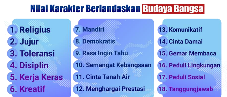
Gambar 1. Nilai karakter pendidikan Indonesia

kerja keras, kreatif, mandiri, demokratis, rasa ingin tahu, semangat berkebangsaan, cinta tanah air, menghargai, bersahabat/komunikatif, cinta damai, gemar membaca, peduli lingkungan, peduli sosial dan tanggungjawab (Sholekah, 2020).