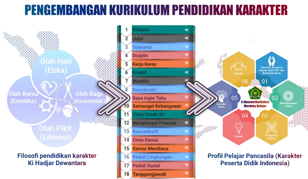
Gambar 6. Pengembangan karakter dalam dimensi kurikulum Merdeka

Landasan filosofis dari kurikulum Merdeka antara lain adalah bahwa pendidikan berakar pada budaya bangsa, kehidupan yang berkembang saat ini dan pembangunan guna kehidupan dimasa depan (Kemendikbudristek, 2022). Selain itu pendidikan juga merupakan sebuah proses pewarisan dan pengembangan sebuah kebudayaan. Pendidikan memberikan dasar bagi peserta didik untuk berpartisipasi dalam pembangunan kehidupan masa kini. Peserta didik juga mampu mengembangkan potensi dan jati diri yang dimilikinya (Laros & Tuhuteru, 2022). Dengan demikian, pengembangan kurikulum menjadi penting untuk menginovasi, memperbaharui, dan mengembangkan kurikulum yang sebelumnya ke arah yang lebih baik.