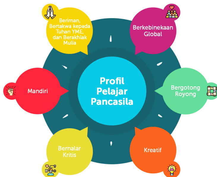
Gambar 3. Dimensi Profil Pelajar Pancasila Kurikulum Merdeka

Pelajar yang kreatif mampu memodifikasi dan menghasilkan sesuatu yang orisinal, bermakna, bermanfaat, dan berdampak. Elemen kunci dari kreatif terdiri dari menghasilkan gagasan yang orisinal serta menghasilkan karya dan tindakan yang orisinal serta memiliki keluwesan berpikir dalam mencari alternatif solusi permasalahan. Menghasilkan gagasan yang orisinal, Menghasilkan karya dan tindakan yang orisinal, Memiliki keluwesan berpikir dalam mencari alternatif solusi permasalahan.