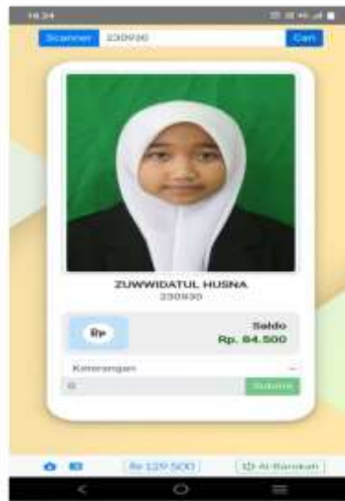
Gambar 2: Menu Pencarian Akun Cashless

melakukan penetapan penganggaran. Dalam penetapan anggaran santri seluruh keuangan yang meliputi, tarik tunai, pembelian mamiri/mamirat, pembelian ATK, pembelian kitab, pembelian alat mandi, laundry, administrasi perizinan, tanggungan kamtib, administrasi telfon, seragam, periksa di Asyifa, dan lain-lain.