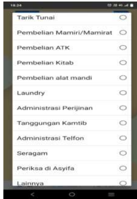
Gambar 3: Menu Kolom Pembayaran Cashless payment