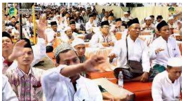
Gambar 4. Prestasi akademik santri Darussalam

Gambar 3. Kegiatan Bahtsul Masail Sejava Madura di Pesantren Darussalam