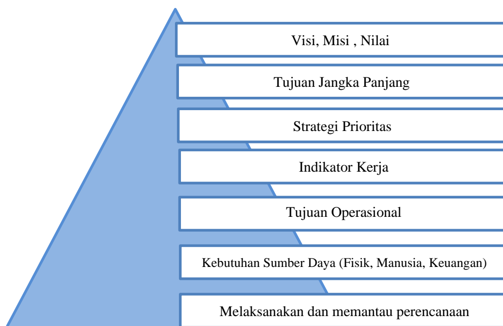
Gambar 2. Piramida Perencanaan Strategi (Fadhli, 2020)

Berdasarkan beberapa definisi yang telah dikemukakan disini, peneliti menyimpulkan bahwa manajemen strategis adalah serangkaian keputusan dan tindakan yang bersifat manajerial serta dilakukan melalui proses pengamatan keadaan saat ini, merumuskan dan menentukan tujuan pada masa depan, kemudian mengimplementasikan dan mengevaluasinya untuk mencapai tujuan dan keberhasilan organisasi.