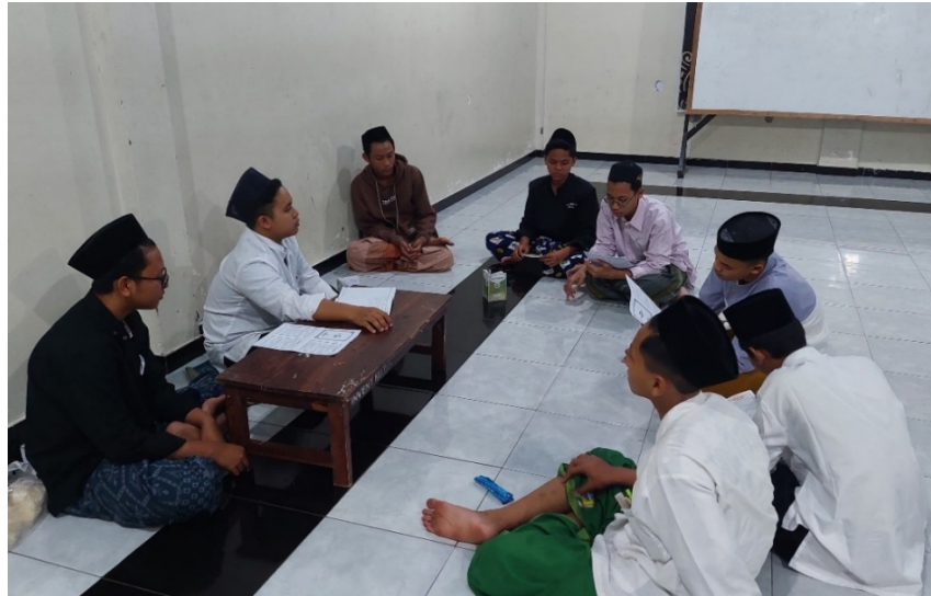
Gambar 3. Kegiatan Mentoring Santri Senior Kepada Santri Junior