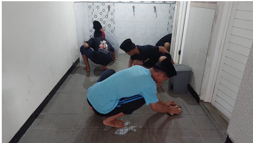
Gambar 1. Kegiatan Kebersihan Kamar Mandi

Hasil wawancara tersebut menunjukkan bahwa pembentukan karakter santri memerlukan pendekatan yang terintegrasi dalam seluruh aspek kegiatan pesantren, bukan sekadar melalui pengajaran formal. Kurikulum yang dirancang berbasis nilai-nilai karakter seperti kejujuran, disiplin, dan tanggung jawab menjadi kunci utama. Semua ini hanya dapat terwujud dengan adanya kepemimpinan yang memiliki visi jelas, yang mampu mengarahkan dan memastikan bahwa setiap aktivitas pesantren selaras dengan tujuan pembentukan karakter santri secara menyeluruh.