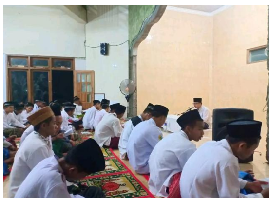
Gambar 1. Pengajian Rutinan

Transparansi dan trust branding tampak dalam praktik nyata yang dilakukan pesantren untuk menjawab kebutuhan masyarakat modern (Harmathilda et al., 2024). Pemanfaatan media digital tidak hanya sebatas sarana informasi, tetapi juga instrumen akuntabilitas. Misalnya, sistem e-payment SPP memungkinkan wali santri melakukan pembayaran secara praktis dan transparan, dengan bukti transaksi yang dapat dipantau langsung. Selain itu, pesantren memanfaatkan live streaming pengajian melalui Instagram atau Facebook, sehingga orang tua dapat mengikuti aktivitas keagamaan anak-anaknya meski tidak hadir secara fisik (Riyandi, 2024). Laporan keuangan dan kegiatan pesantren juga dipublikasikan secara online melalui website resmi atau grup WhatsApp wali santri, sehingga meminimalkan kecurigaan dan meningkatkan rasa percaya. Praktik-praktik ini memperlihatkan bahwa digitalisasi tidak sekadar inovasi teknis, melainkan menjadi mekanisme sosial yang memperkuat reputasi, legitimasi, dan ekuitas merek pesantren di mata masyarakat luas. Dokumentasi ini memperlihatkan bagaimana pesantren memanfaatkan teknologi digital sebagai sarana akuntabilitas publik sekaligus membangun citra positif di mata masyarakat.